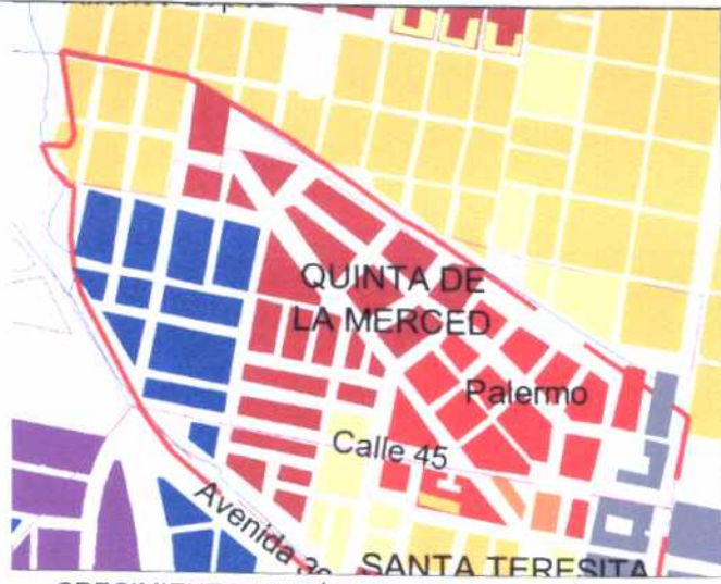
CRECIMIENTO HISTÓRICO - CRONOLOGIA