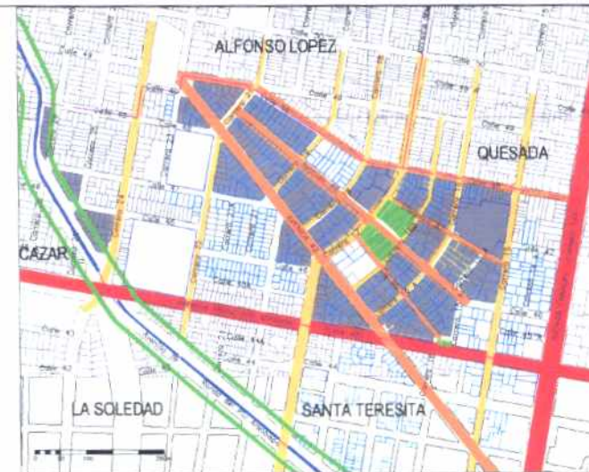
Inmuebles de Interés Cultural - MORFOLOGIA EN PLANTA